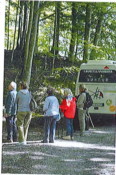
Turismo in Casentino. Aiuti economici del Gal, anche per attività ricettive

uffici del Gal sono a disposizione per rispondere a eventuali dubbi interpretativi e per facilitare la presentazione della domanda. I bandi sono stati pubblicati sul Bol-